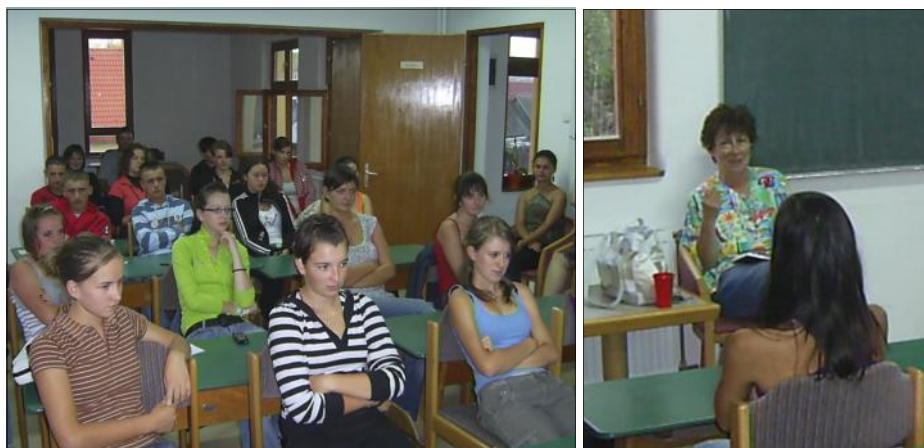
» A szexualitásról szóló előadáson elhangzottak számos helyi fiatal érdeklődését felkeltették.

Az első ilyen alkalomra szeptember 9-én került sor, amelyre felkértük