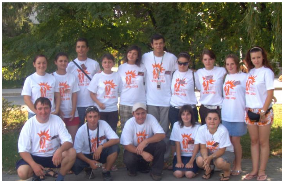
» Az idén a REMISZ szép számban képviseltette magát a testvérvárosi ifjúsági napokon. (ETNA 2008)