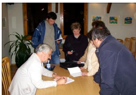
» Az író a bemutató után dedikálta könyvét.