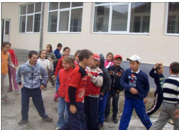
» Szünetben. Szeptembertől vidám gyermekzsivaj tölti be a vaskapus iskola udvarát.