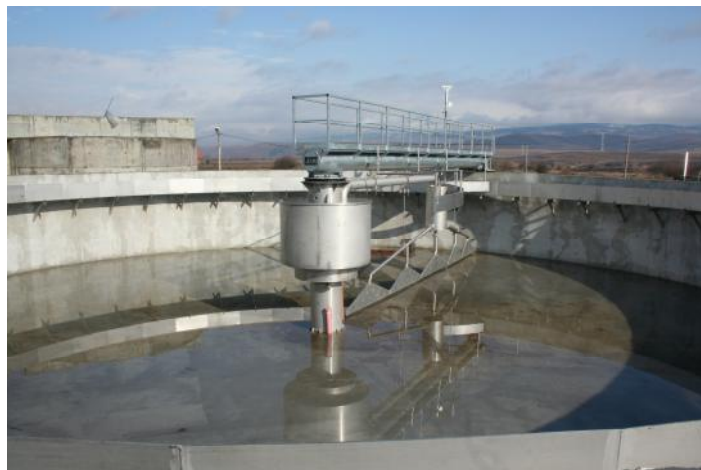
» Jövő hónapban adják át Hargita megye legnagyobb szennyvíztisztító-állomását.