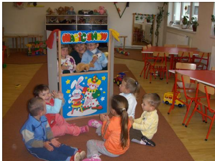
» Bábszínház. A felújított óvodaépületben minden biztosított a minőségi oktatáshoz.

mindkét esetben részben veszélyesek és a legkisebbek. Az utak rossz állapota miatt egyelőre nem működik, de esélyes a megszüntetésével ismét beüzemelik. A sérült gyerekek és a jégkorongozók fuvarozása továbbra is ezzel történik.