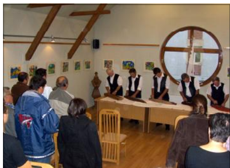
» A közönség felállva énekelte a székelyhimnuszot.

Jöve re is meg szeretnénk szervezni ezt az ünnepséget. Reméljük legalább ilyen színes programmal és még több érdeklődővel. » PORTIK-BAKAI ÁDÁM «