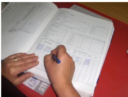
» A nyilvántartást a mezőgazdasági irodában végzik.

Háztartás alatt értjük azon személyek, rokonok összességét, akik egy helyen laknak és gazdálkodnak, közös vagyonnal rendelkeznek.