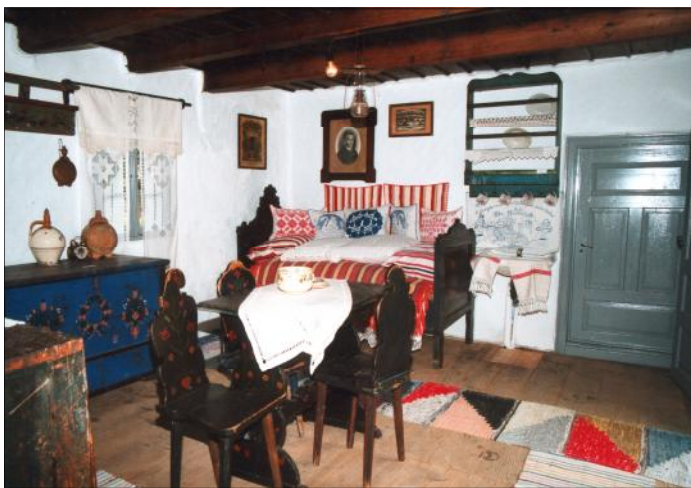
» A tájházban megtekinthető a remetei vetett ágyra jellemző párnák, csipkés takarók egy része.

jait. Kékre festett székely mintákkal díszített fejes ágy volt. Benne legalul a szalmazsák (dusza). A szalmazsák leterítve a vetett ágyra való, gyönyörű széles csipkés lepedővel. A csipke fölött a széles szegély után azsúr követ-