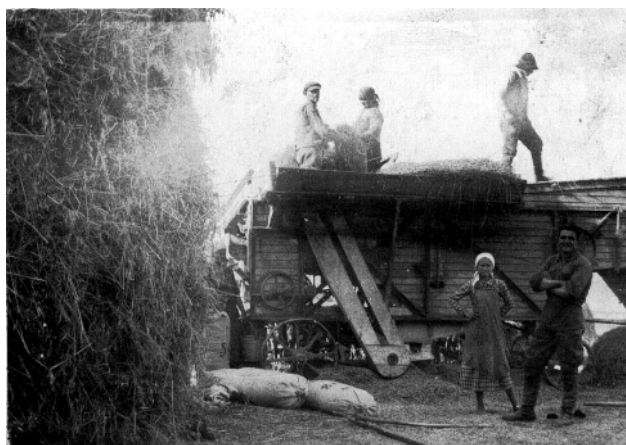
» Őszi termény-betakarítás idején cséplés hagyományos eszközökkel.

Szeretettel kérjük a kedves falustársakat, hogy jelenlétükkel pártolják fel a kezdeményezést.