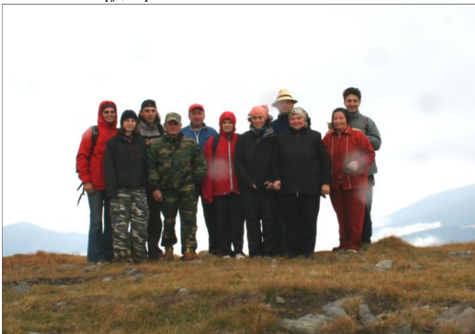
» A Kelemen-havasokban együtt töltött hétvége a munkatársi kapcsolatok megerősítéséhez is hozzájárult.