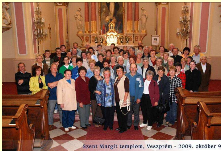
Szent Margit templom, Veszprém - 2009. október 9.